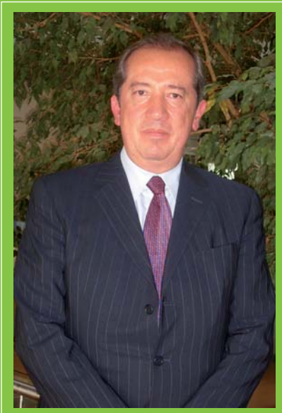
Message from the Chairman