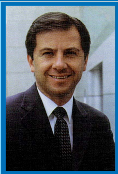
Message from the General Director