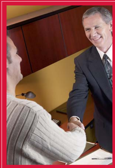
Labor and Human Resources